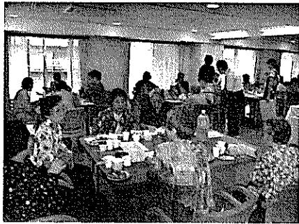
人と人をつなぐ会でのサロンのようす

ひとり暮らし高齢者の孤独死の増加を受け、2007年11月に戸山団地の住民らを中心に法人設立。高齢者世帯や一人暮らしの世帯に機器を設置しコールセンターと結んで、毎日の安否確認や、高齢者の話し相手、暮らしのネットワークづくりの提案活動などを通じて独居高齢者の生活支援に取り組んでいる。